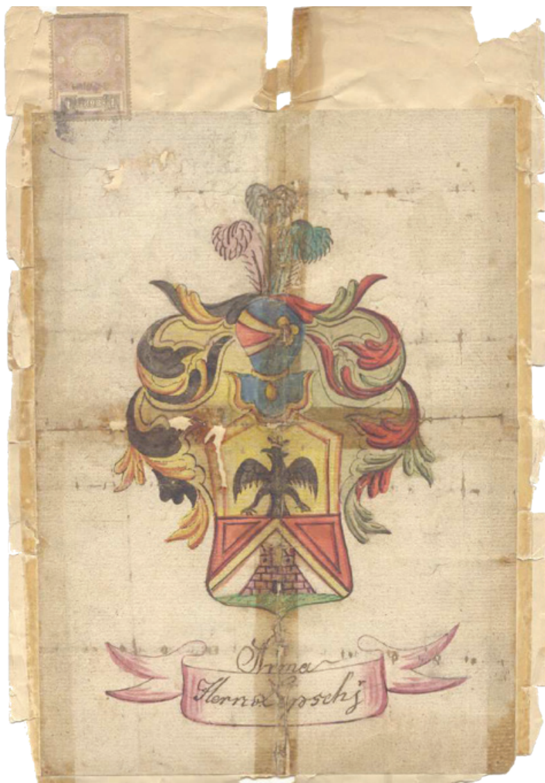
Fot. 2. Pieczęć herbowa rodziny Lepszych