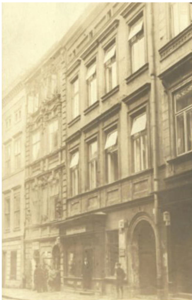
Fot. 13. Mieszkanie Lepszych na drugim piętrze w Krakowie przy ul. Brackiej 13