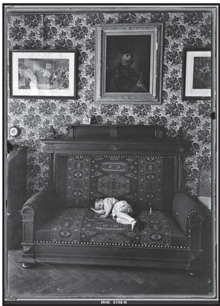
Fot. 12. Kazimierz Lepsi (czwarty syn L. Lepszego z trzeciego małżeństwa) w wieku dwóch lat